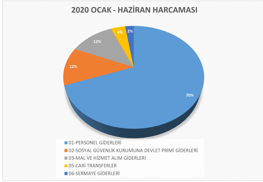
Grafik 2. Ocak-Haziran Gider Gerçekleşmesi Ekonomik Sınıflandırmaya Göre Dağılımı

Üniversitemizin 2020 başlangıç ödeneği ile yılsonu harcama tahmini artış %'si TABLO 1'de görüldüğü gibi % 12,58 olarak ortaya çıkmıştır.